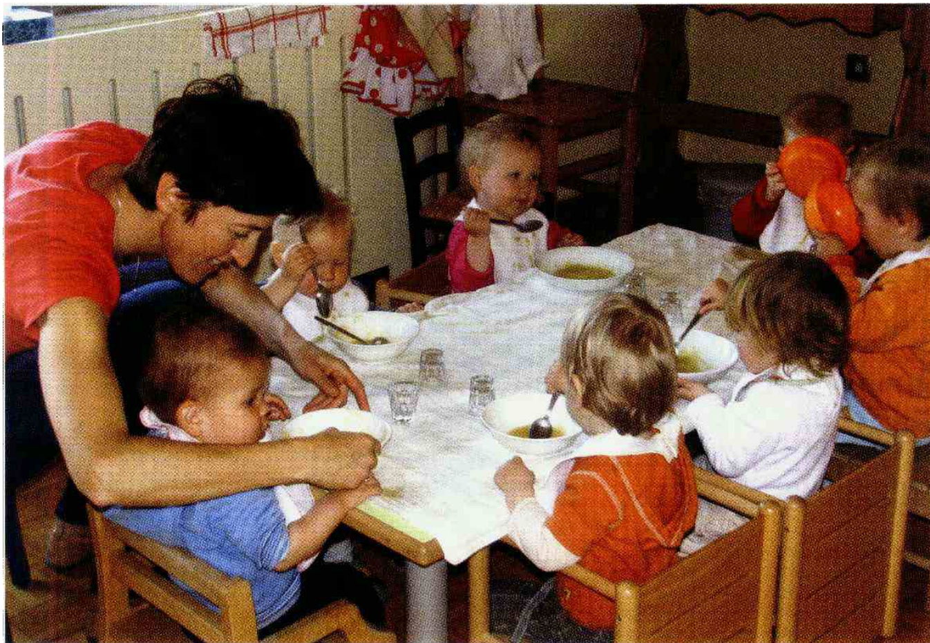
V podjetju Halcom imajo zaposleni za svoje otroke na voljo tudi vrtec. Ta deluje po metodi Montessori z angleško govorečo vzgojiteljico, ki otroke že od malih nog spodbuja k učenju tujega jezika.