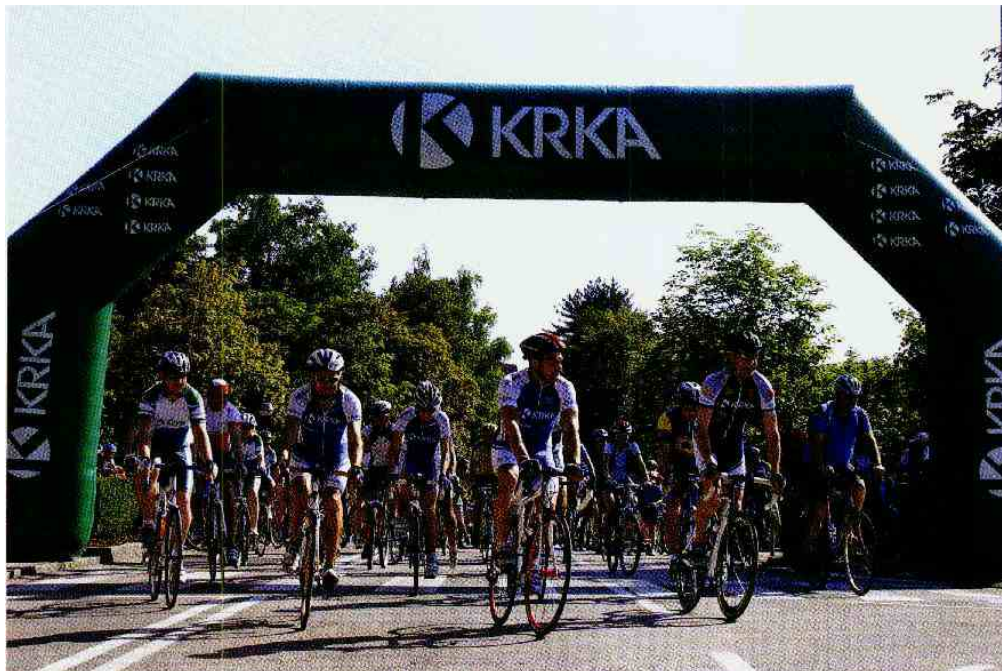
Zaposleni v Krki se srečujejo zunaj delovnega časa v Trim klubu Krka, ki vsako leto organizira športne dejavnosti, ki se jih udeleži več kot tisoč zaposlenih. Ena takih prireditev je tudi kolesarski izlet.

zne sodelavce in jim omogočijo, da si izberejo projekt, ki se jim zdi tržno zanimiv, člani uprave S&T pa jim pomagajo finančno, kadrovsko in s svetovanjem. Tako je denimo njihova poslovna sekretarka pripravila poslovni načrt, kako povečati učinkovitost poslovne administracije, in ga predstavila vodstvu podjetja, ki je načrt podprlo.