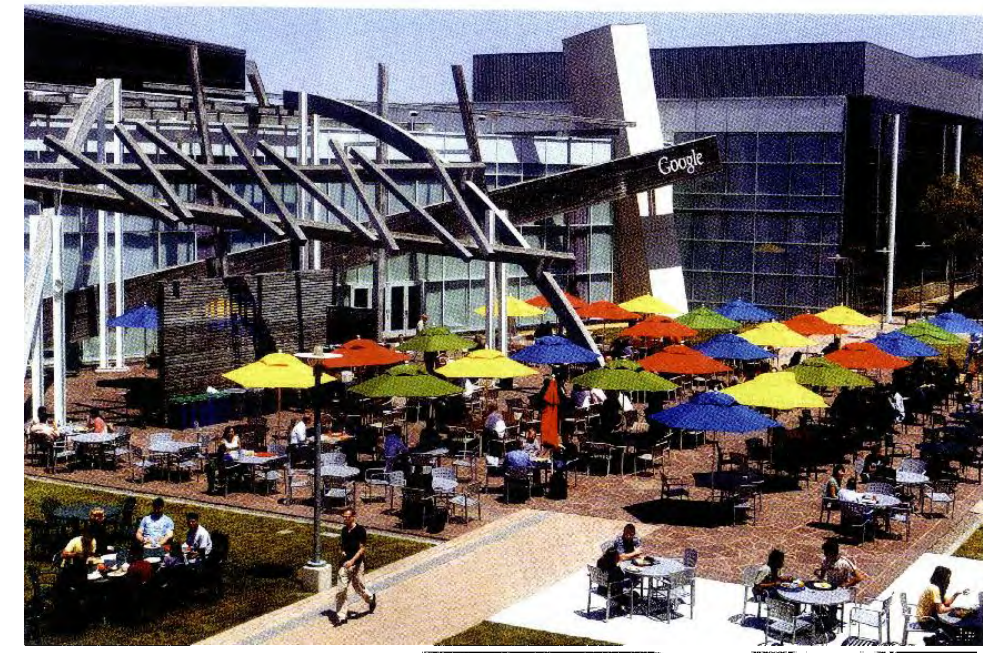
V Googlu znajo motivirati zaposlene. Tisti, ki denimo kupi hibridni avto, mu družba podari pet tisoč dolarjev okoljskega dodatka.

Tako kot so pri milijonih kupcev zaželeni Applovi izdelki, je tudi podjetje samo priljubljeno pri iskalcih zaposlitve, čeprav na zunaj ni slišati kakšnih pretiranih hvalnic o tem, kako lepo je biti zaposlen v podjetju, ki ima sedež