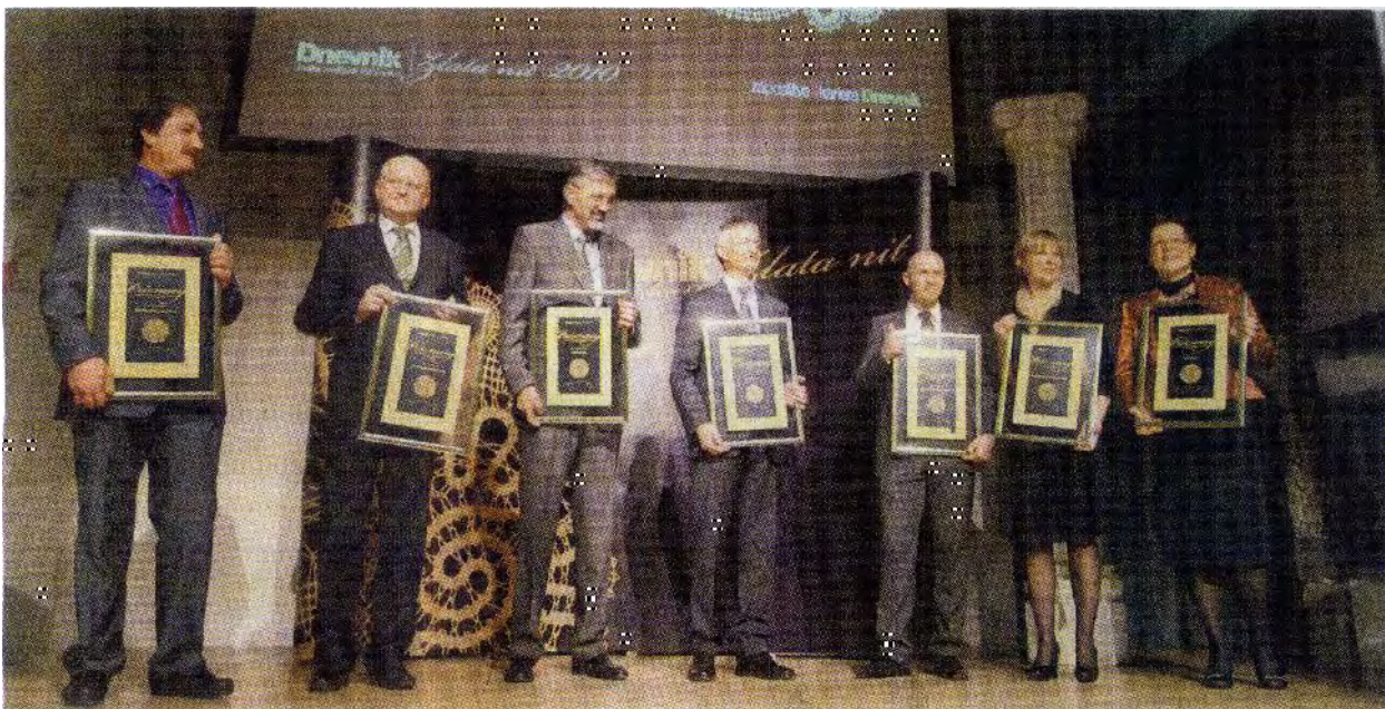
Sedmerica finalistov v kategoriji srednje velika podjetja: Četrta pot, Geoplin plinovodi, Halcom, Medis, Microsoft, Roche farmacevtska družba in SAOP, ki je bil med njimi prepoznan za najboljšega zaposlovalca Zlate niti 2010.