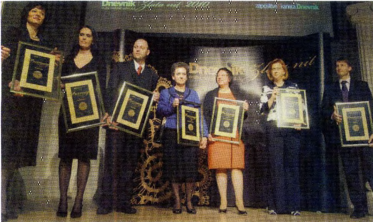
Sedmerica finalistov v kategoriji mala podjetja: Bonopan, Hair Beauty, Intera, Kompas Xnet, List, Vivo (najboljši zaposlovalec Zlate niti 2009 in 2010) in Xlab (prejemnik posebnega priznanja za oblikovanje inovativne organizacijske kulture).