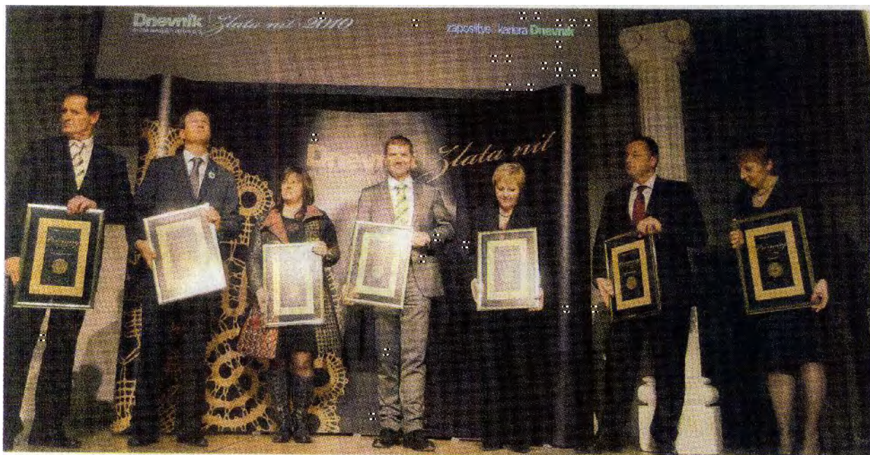
Sedmerica finalistov v kategoriji velika podjetja: Krka, Lekarna Ljubljana, McDonald's, Simobil (najboljši zaposlovalec Zlate niti 2009 in 2010), SKB, S&T in Trimo